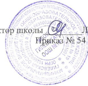
График приема пищи детей, с учетом соблюдения социальной дистанции, в связи с распространением коронавирусной инфекции (COVID -19) МБОУ Гилевская ООШ № 19